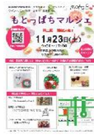
もとっぱちマルシェ